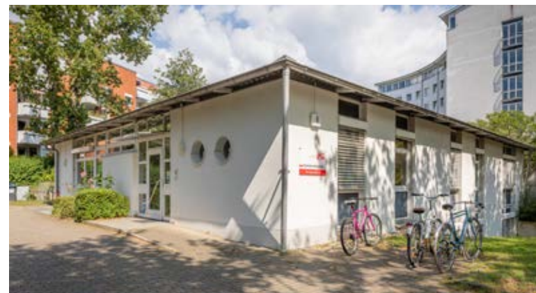
Gestaltung: Verena Altmann | Druck: Caritaswerkstätten St. Georg | 03/22

Sundgauallee 8, 79110 Freiburg Telefon (07 61) 79 03-2118 migrationundintegration@caritas-freiburg.de www.migration-integration-freiburg.de